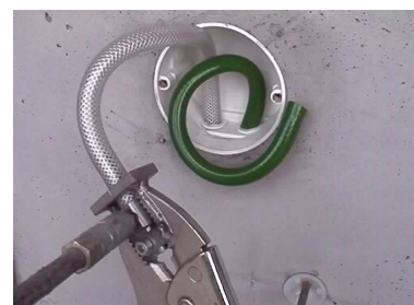
Käytettäessä kahta eri väristä syöttöletkua injektointiletkujen eri päissä, on letkujen sisään- ja ulosmenot helppo tunnistaa injektointia suoritettaessa.