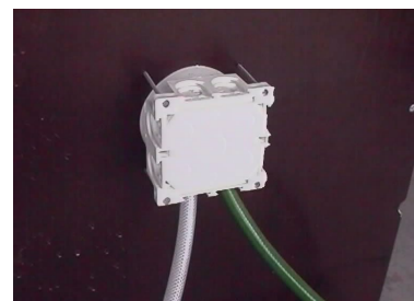
Syöttöletkuja on helppo käsitellä injektoidessa, kun ne on asennettu asennusrasioihin.