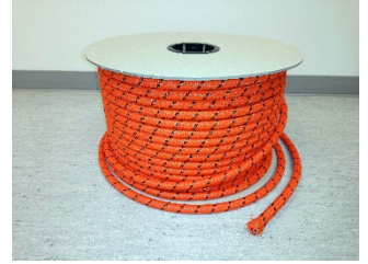
WEBAC Typ 2