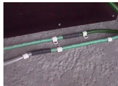
Limitä injektointiletkuja n. 50 mm jatkoskohdissa ja kiinnitä letkut vähintään 20 cm välein.